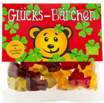
Glücks-Bärchen „Kleeblatt“, 75g