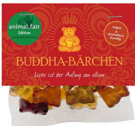
a) 75g mit Klappkarte

Standardgröße mit 75g Fruchtsaftbärchen (15 Bärchen)