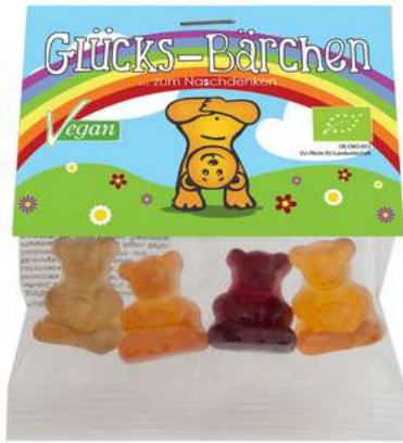
Glücks-Bärchen „Regenbogen“ (Standard)