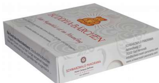
b) 75g in der Geschenkbox