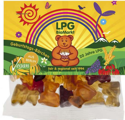
Logointegration in bestehendes Motiv